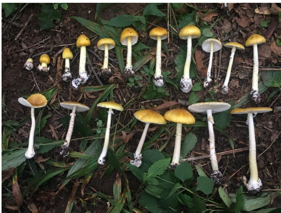
图 B.3 不同生长阶段的蘑菇示例