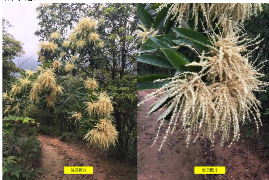
图 B. 1 生境照片示例