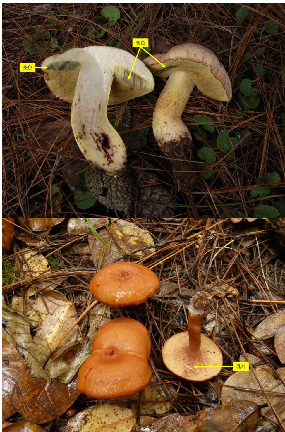
图 B. 5 剖面及损伤示例