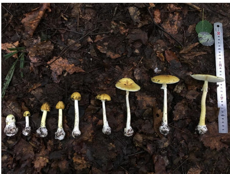
图 B.4 添加标尺的蘑菇示例