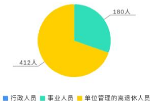
人员情况构成饼图